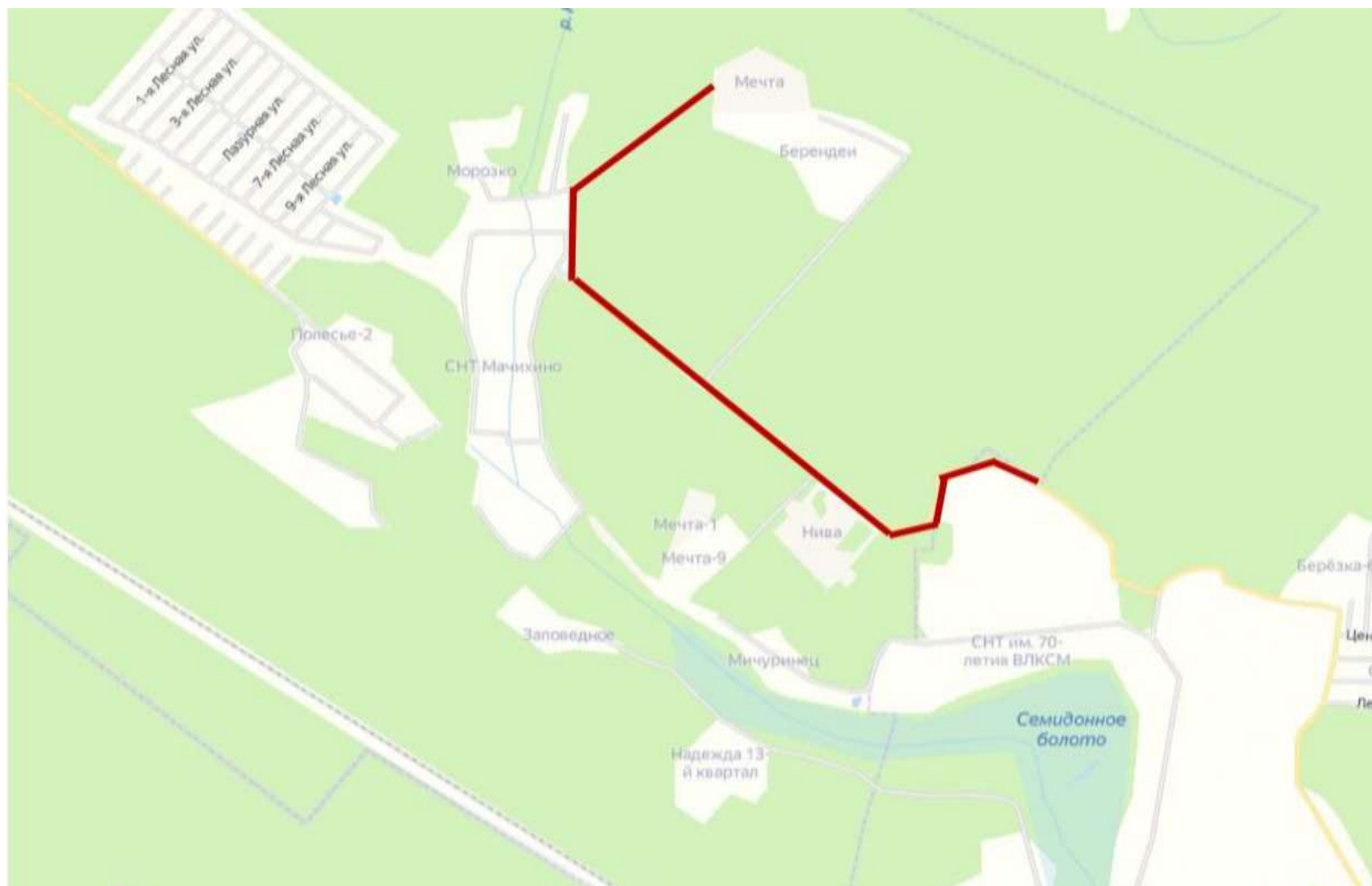
Схема расположения дороги к СНТ «Мечта» (Мачихино)